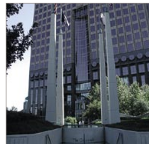
JP ha devuelto los 25.000 millones.

Por su parte, Wells Fargo ha registrado un beneficio de 4.959 millones de dólares en los primeros seis meses del