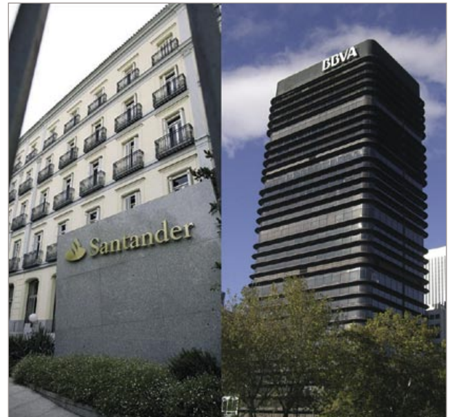
Santander y BBVA están dentro de los cinco primeros bancos del mundo.

Los resultados del primer semestre del año en Estados Unidos sugieren que de nuevo el ranking del 2009 va a ser muy distinto. Pese a la desconfianza que persis-