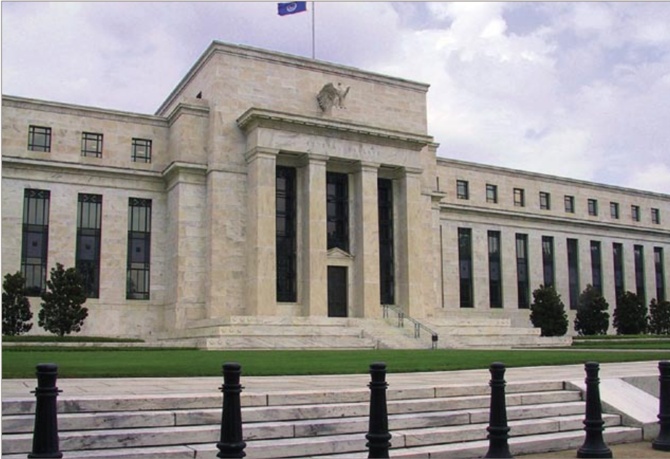
La Reserva Federal ha ampliado su balance a más de un billón de dólares para inyectar liquidez a los bancos.

asegurar a los senadores que la economía está en vías de curación, tras la recesión más prolongada desde la Gran Depresión de los años 1930, y la más profunda en más de cinco décadas. Además de aplicar una política monetaria generosa, muy distinta a la aplicada en los años 30, y de la compra de todo tipo de activos a las instituciones financieras en los últimos 17 meses para inyectarles liquidez, la Reserva ha ampliado su balance a más de un billón de dólares con la adquisición de bonos del Tesoro y ha creado reservas enormes en los bancos.