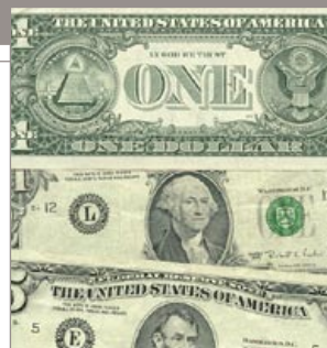
La banca ganó 43.524 millones.

En mayo pasado, el Gobierno estadounidense incluyó a esta entidad entre la decena de bancos que consideró necesitaban reforzar sus reservas de capital para afrontar un posible empeoramiento de la crisis económica y determinó que requería 13.700 millones de dólares. La entidad precisó